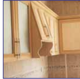
Kaliteli Mutfak Dolapları Quality Fitted Kitchen

We brought together all the details to provide you a better life