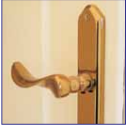
Kaliteli Aksesuarlar Quality Accesories