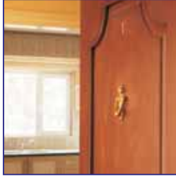
Amerikan Hazır Kapı Fit-in American Doors