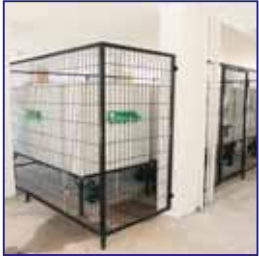
Korunaklı Su Depoları Fenced Water Tanks