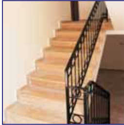
Geniş Merdivenler Spacious Steps