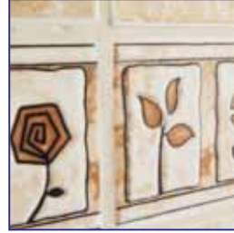
Seramik Seçenekleri Selection of Tiles

Yaşam kalitenizi artıracak tüm detayları biraraya getirdik